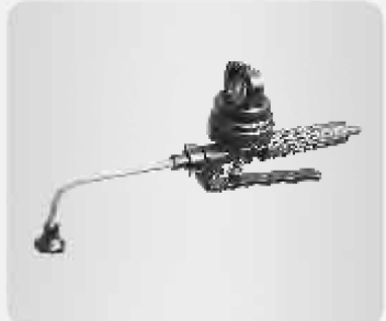
Dosificador universal de líquidos